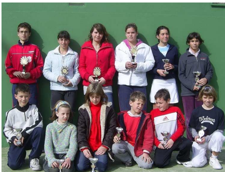
Foto dels campions i finalistes del social.